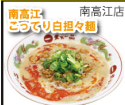
白味噌仕立ての「特製担々」。白味噌のほのかな甘みとラー油のピリツとした辛味が絶妙の美味しさです。