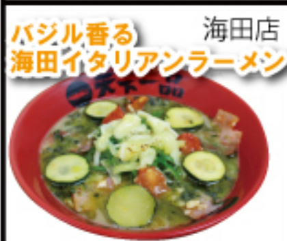
ジェノベーゼ×こってり。具材には、ズッキーニトマト、チーズを使い、イタリアンに仕上げました。