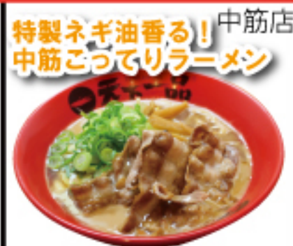
香り立つ「特製ネギ油」が食欲をそそります。こんがり焼いた豚バラ肉でボリュームもある一杯。