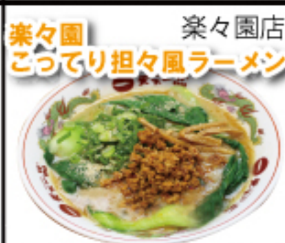
決め手は、特製担々(肉味噌)。肉の旨みが味わいにコクと深みをもたらします。