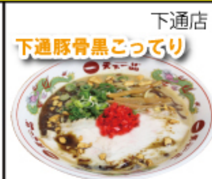
「こってり」×「豚骨」のWスープ仕上げに「ラー油」を加え、スープの旨みを一層引き出します。