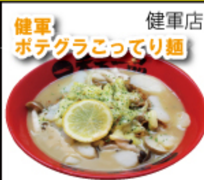
こってりとポテグラタン風トッピングのコラボ!マイルドな濃厚なこってりラーメンをお試し下さい。