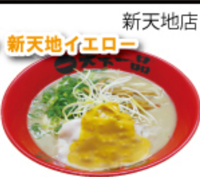
イエローの正体は、「特製辛味噌ソース」。マイルドな酸味と辛さが、後を引く美味しさ!