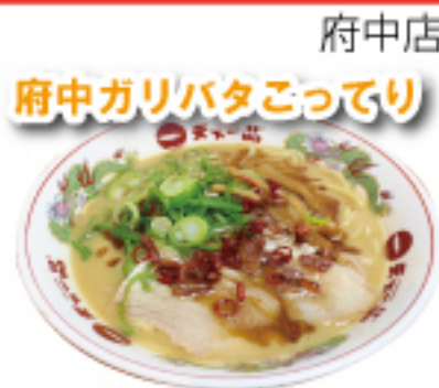
こってりの旨味そのままに、ニンニクとバターを加え風味良く仕上げました。