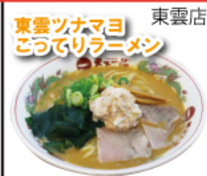
和風醤油だれのこってりスープとツナマヨの相性抜群。マイルドかつ濃厚な味わいに仕上がりました。